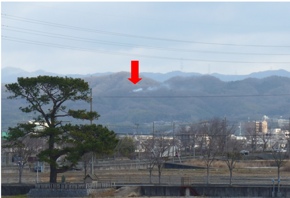
写真14：曾根山地区より1回目の黄色煙を撮影