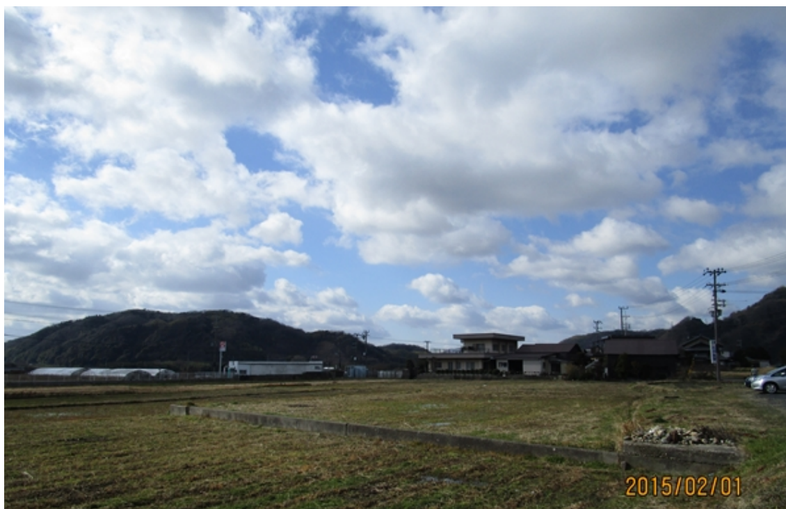
写真20：和束町木屋より鹿背山城方面を撮影

肉眼での観測は出来なかった『のろし』も、画像ではうっすらと煙がたなびいているのが確認できました。はるか後方には生駒山が見えます。