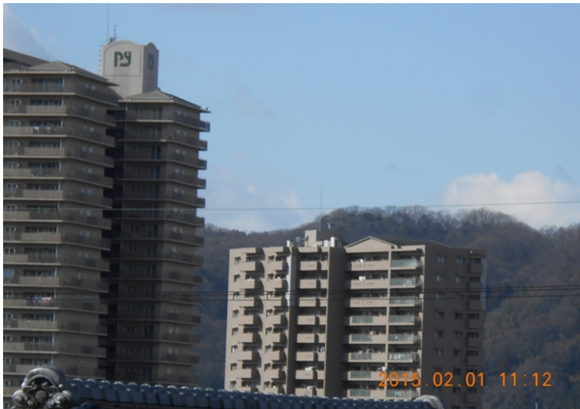
写真18：海住山寺より1回目の白色煙を撮影