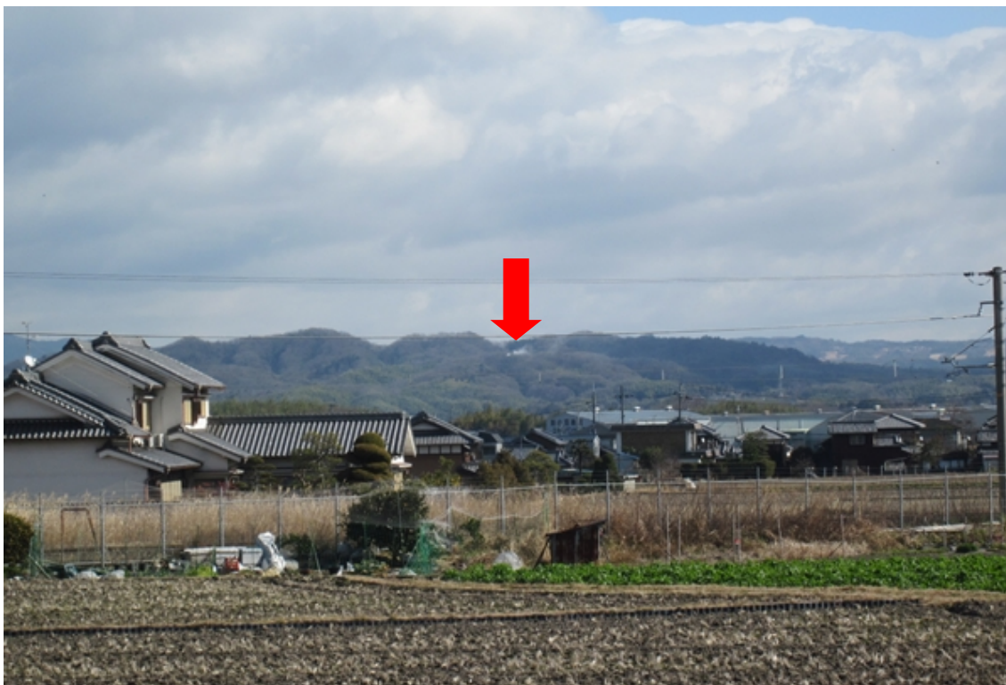
写真16：岩船寺貝吹岩より1回目の白色煙を撮影